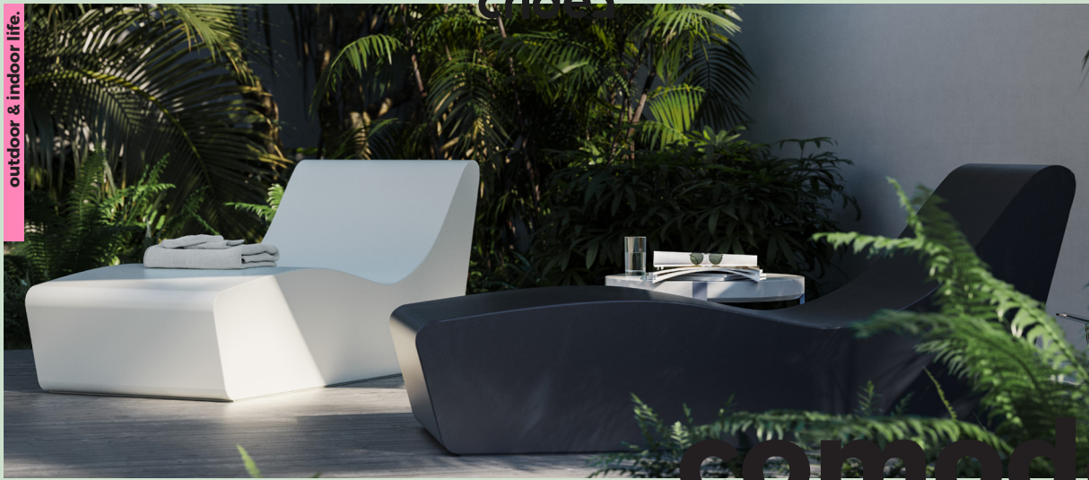
by Cridea Team.